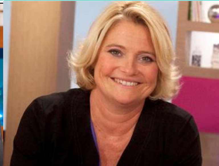
Marina Carrère d'Encausse